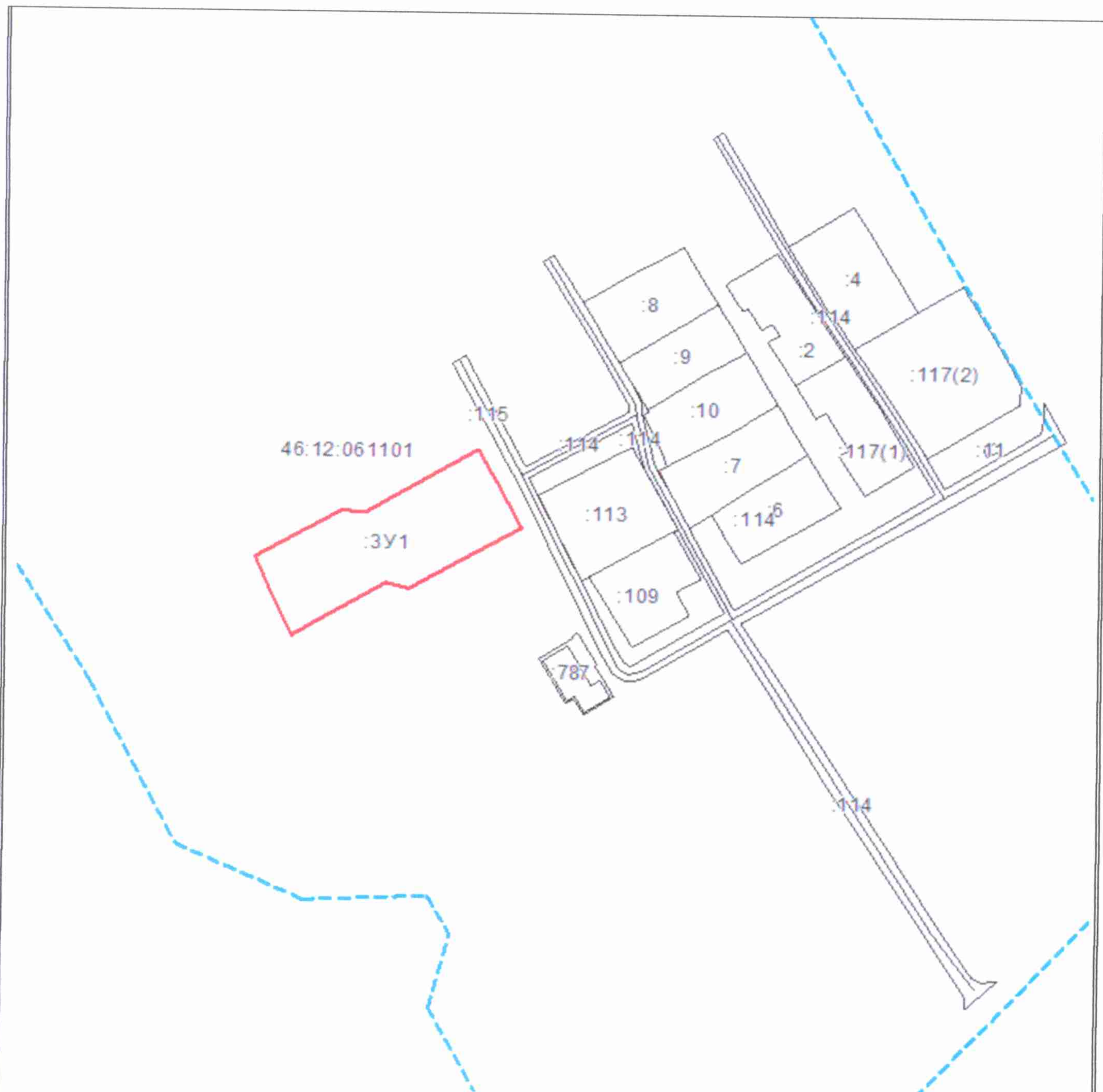
Схема расположения земельного участка в кадастровом квартале 46:12:061101