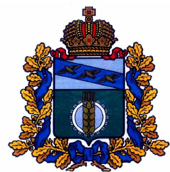
Схема градостроительного зонирования территории муниципального образования "поселок имени К.Либкнехта" Курчатовского района Курской области

УТВЕРЖДЕНО решением Собрания депутатов поселка имени К.Либкнехта Курчатовского района Курской области от 16 апреля 2019 года № 165